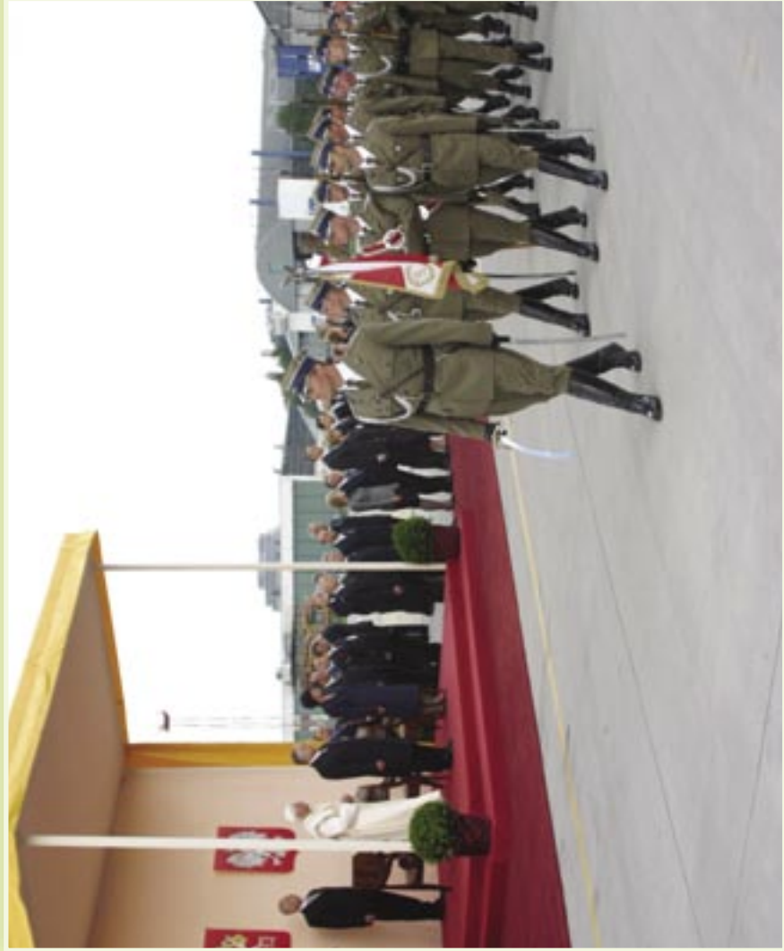
Ceremonia powitania Ojca Świętego Benedykta XVI na lotnisku Okęcie, 25 maja 2006 r.