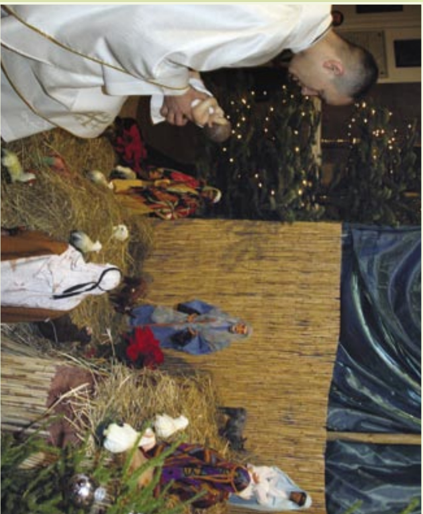
Pasterka w Katedrze Połowej WP, 24 grudnia 2006 r.